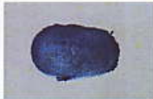
Left hand Thumb of Candidate

2. The CASTE and INCOME certificate to be produced by candidates during seat selection process should have the same CASTE and INCOME, as mentioned in this Application Form. No change in Caste / Category will be permitted after the final declaration.